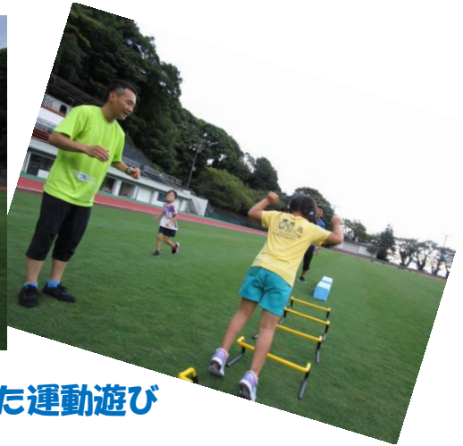
ミニハードルや大縄跳び、色々な遊具を使った運動遊び

期 日： 9月9日(月)・13日(金)・20日(金)・27日(金)・30日(月) 5日間 時 間： 15:30~16:30(1時間) 対 象： 4歳以上の未就学児 場 所： 城山陸上競技場フィールド〈芝生〉:(雨天時:トレーニングルーム) 定 員： 15名(先着順) 参加料： 3,000円(傷害保険料含む)